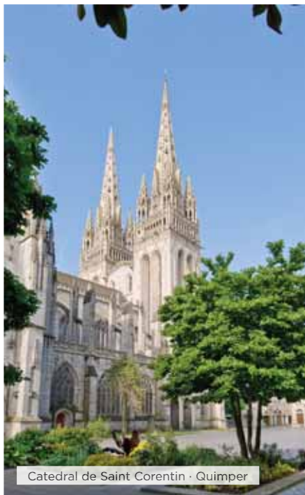
Catedral de Saint Corentin · Quimper

Desayuno. Salida hacia Dinan, que conserva casi todos sus edificios medievales originales. Tiempo