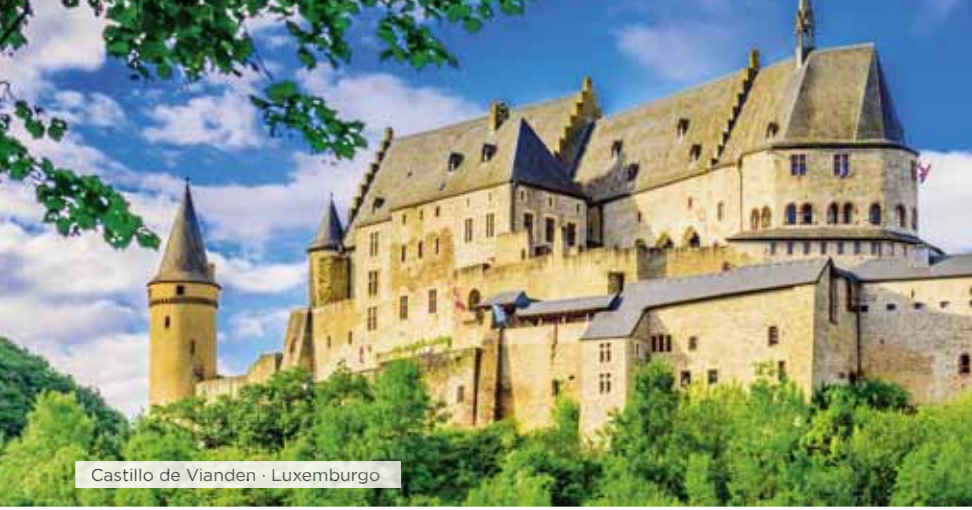
Castillo de Vianden · Luxemburgo