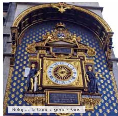
Reloj de la Conciergerie · París

Hoteles alternativos y notas ver páginas 16 y 17.