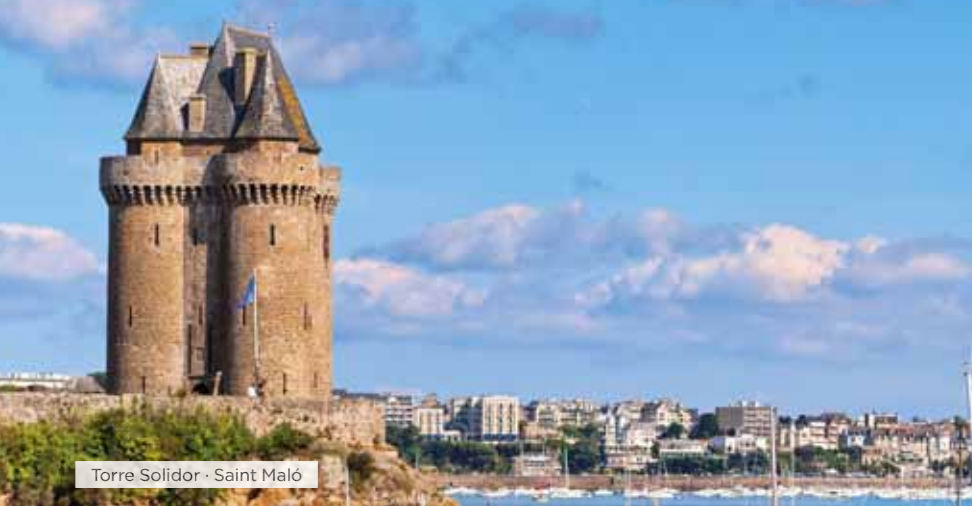
Torre Solidor · Saint Maló