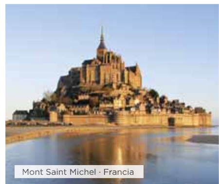
Mont Saint Michel · Francia

Hoteles alternativos y notas ver páginas 16 y 17.