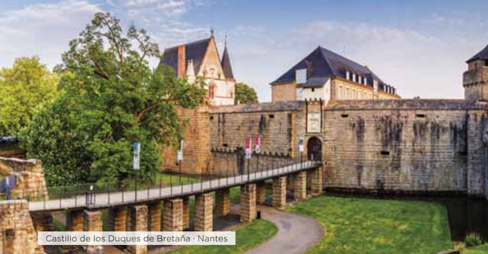
Castillo de los Duques de Bretaña · Nantes