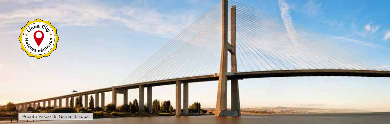
Puente Vasco de Gama · Lisboa