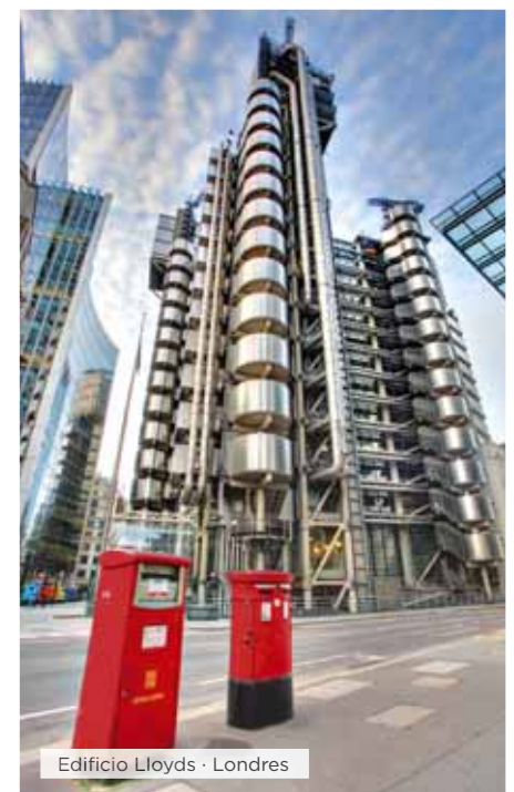
Edificio Lloyds · Londres