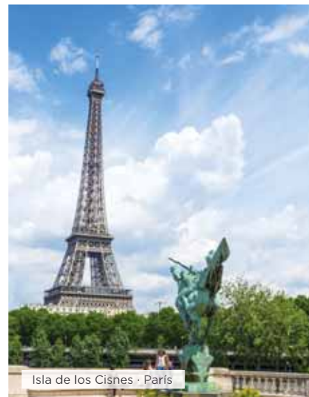
Isla de los Cisnes · París

Desayuno. Tiempo libre hasta la hora del traslado al aeropuerto para tomar el vuelo a su ciudad de destino. Fin de nuestros servicios. ■