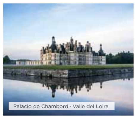
Palacio de Chambord · Valle del Loira

Hoteles alternativos y notas ver páginas 16 y 17.