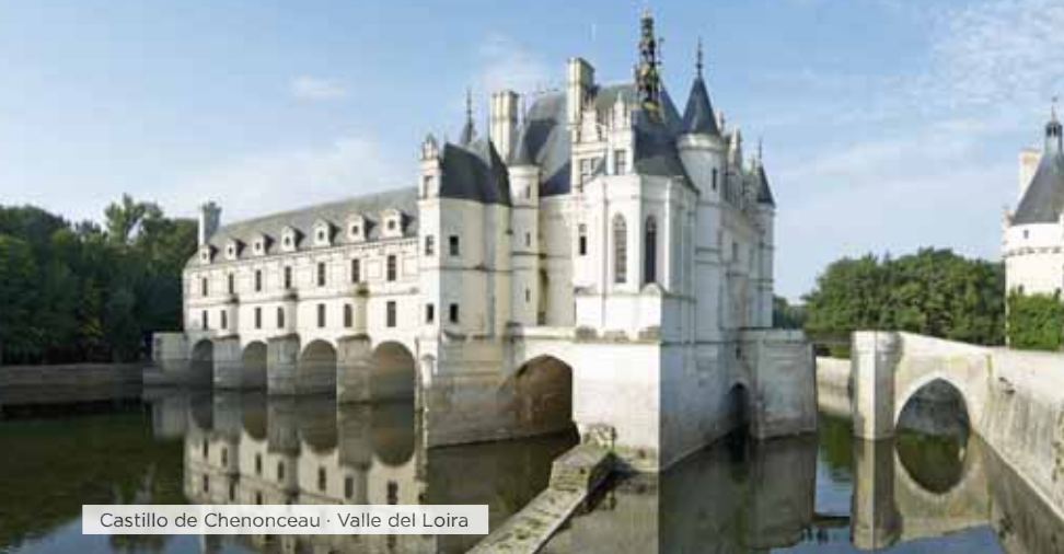
Castillo de Chenonceau · Valle del Loira