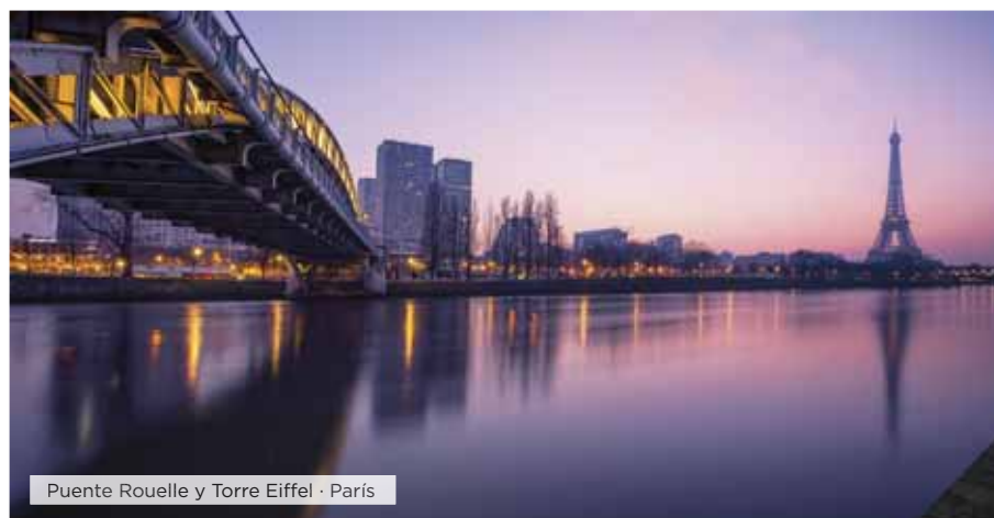
Puente Rouelle y Torre Eiffel · París