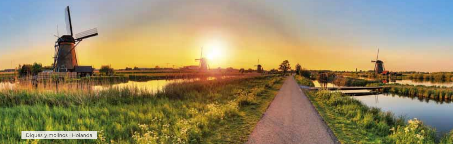
Diques y molinos · Holanda