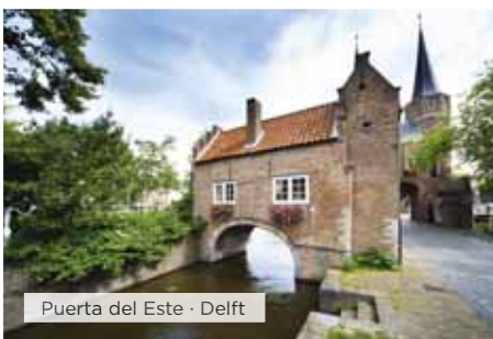
Puerta del Este · Delft

Desayuno. Salida hacia Folkestone para, en el "Shuttle" *, realizar en 35 minutos la travesía bajo el Canal de la Mancha y dirigirnos hacia Francia (En ciertas ocasiones este trayecto se realizará vía Brujas). Llegada y tiempo libre para un primer contacto con la elegante capital francesa. Por la noche tour opcional de París Iluminado, donde podremos confirmar el porqué está considerada por muchos la ciudad más bella del mundo. Alojamiento.