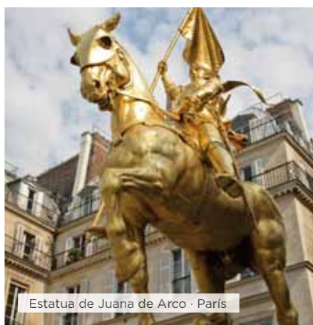
Estatua de Juana de Arco · París

Desayuno. Día libre para seguir recorriendo la ciudad. Si lo desea, podrá visitar opcionalmente el