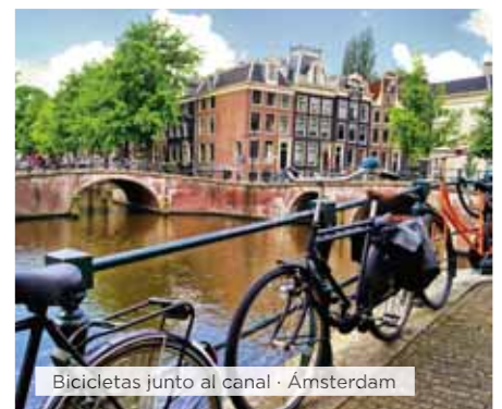
Bicicletas junto al canal · Ámsterdam