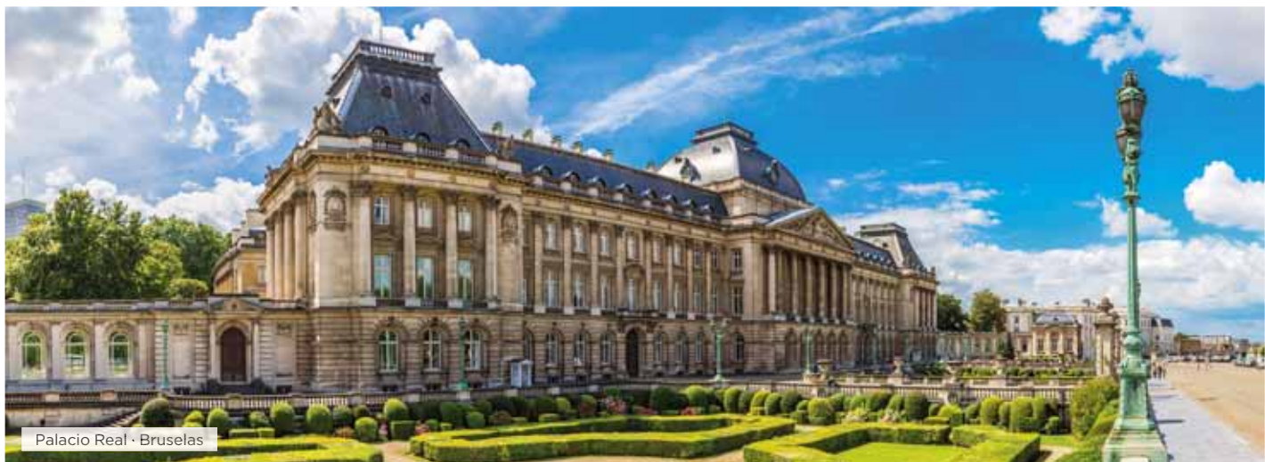
Palacio Real · Bruselas

Hoteles alternativos y notas ver páginas 16 y 17.