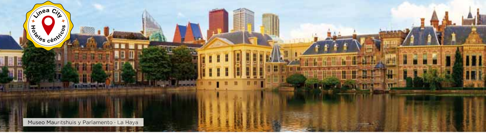
Museo Mauritshuis y Parlamento · La Haya