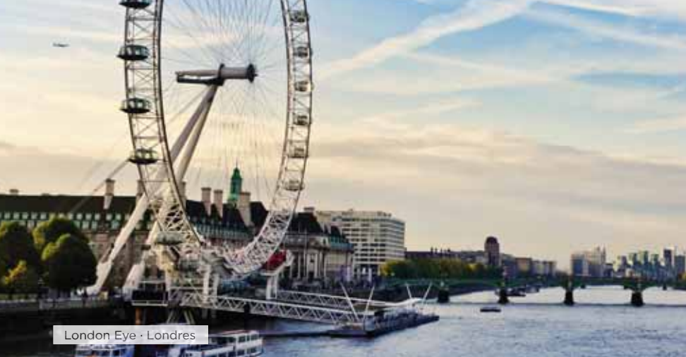
London Eye · Londres