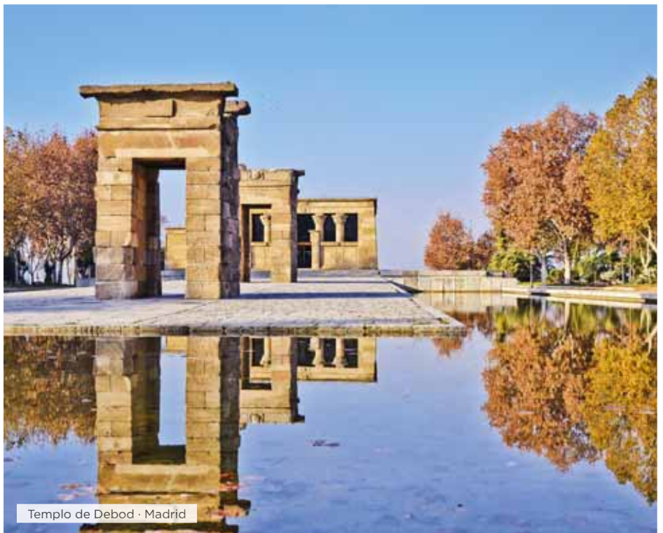
Templo de Debod · Madrid

Desayuno. Visita panorámica de los edificios y monumentos más característicos: las Plazas de la Cibeles, de España y de Neptuno, la Puerta del Sol, la Gran Vía, Calle Mayor, exterior de la Plaza de toros de las Ventas, calle Alcalá, Paseo del Prado, Paseo de la Castellana, etc. Resto del día libre para recorrer las numerosas zonas comerciales de esta capital o tomarse un descanso en algunas de las numerosas terrazas que salpican la ciudad, o si lo desea, podrá realizar una completísima visita opcional a Toledo. Realizaremos un recorrido en autobús por el perímetro de la ciudad, desde el que tendremos una espléndida vista general de su patrimonio artístico y pasearemos por sus callejuelas y plazas más emblemáticas, incluyendo la entrada al interior de la Cate-