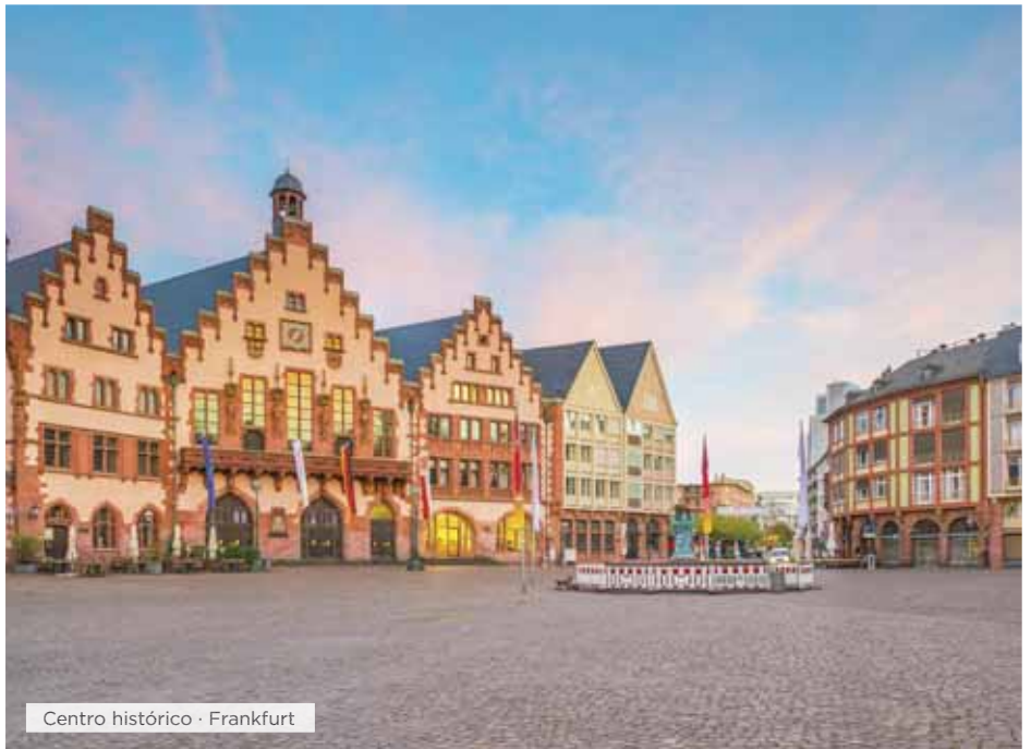
Centro histórico · Frankfurt

Desayuno. Salida hacia Calais y cruce del Canal de la Mancha en agradable recorrido en ferry. Llegada a Londres y tarde libre para recorrer lugares tan emblemáticos como Oxford Str, Knightsbridge Road, Hyde