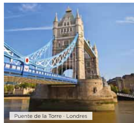
Puente de la Torre · Londres