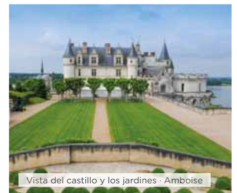
Vista del castillo y los jardines · Amboise

Hoteles alternativos y notas ver páginas 16 y 17.