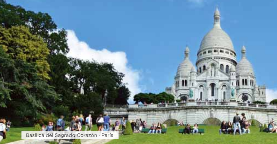
Basilica del Sagrado Corazón · París