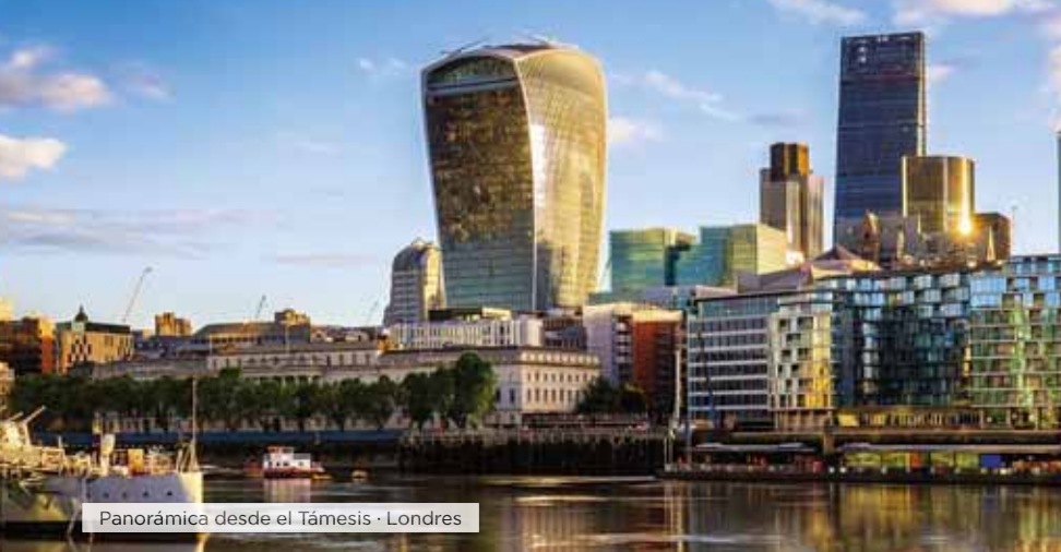
Panorámica desde el Támesis · Londres