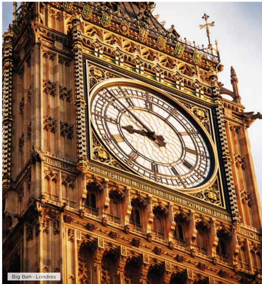
Big Ben · Londres