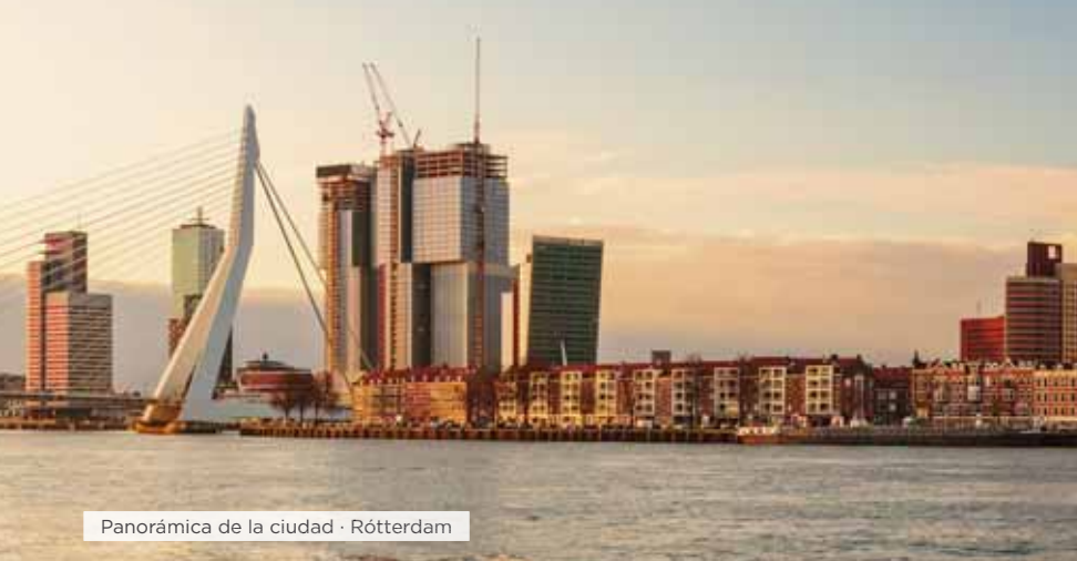
Panorámica de la ciudad · Róterdam