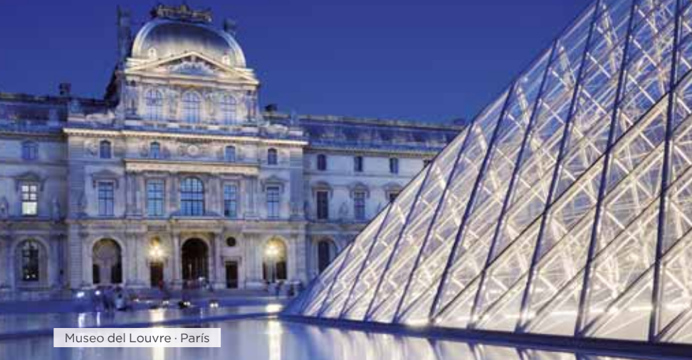
Museo del Louvre · París